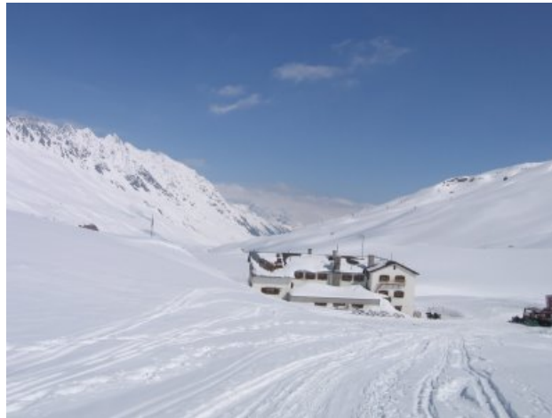
Refugio Heidelberger Hutte.

Para los esquiadores de montaña, la travesía de la Silvretta es la que tiene más tradición de los Alpes austriacos y que con los años se ha convertido en una gran clásica. Esto es debido a una serie de condiciones que han convertido a este macizo en una zona privilegiada para el esquí de montaña, como su clima continental con una innivación envidiable y picos en su mayoría esquiabiles, además de una red de refugios muy completa y cómoda.